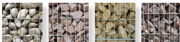
Galets du Rhin Granit rosé Calcaire jaune Granit rouge

Ces matériaux sont disponibles en cliquant ici !