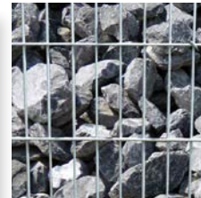
Galets du Rhin