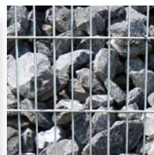
Galets du Rhin