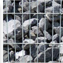
Galets du Rhin